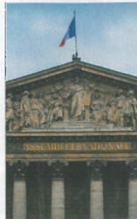
La façade de l'Assemblée a été réalisée en 1806 par l'architecte Bernard Poyet. De style classique, ses douze colonnes sont ornées de chapiteaux corinthiens.

Aucun membre du Parlement ne peut faire l'objet d'une arrestation ou de tout autre mesure privative ou restrictive de liberté sans l'autorisation du Bureau de l'Assemblée dont il fait partie, selon l'article 26 de la Constitution française. L'immunité parlementaire, instituée à l'origine pour préserver le député d'éventuelles pressions, n'offre pas pour autant l'impunité. Elle peut être levée, autorise la mise en examen (qui n'est pas une privation de liberté),