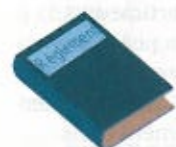
Un règlement de l'Assemblée

Chaque élu se voit remettre à son arrivée à l'Assemblée nationale une sacoche contenant :